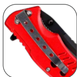
CLIP PARA cinturón.