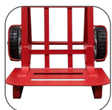
PARRILLA de gran capacidad y resistencia.