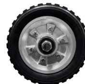
RUEDAS DE 10" sólidas.