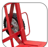
OREJAS DE protección.