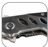
BLOQUEO DE NAVAJA, se presiona para cerrar.