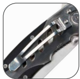
CLIP PARA cinturón.