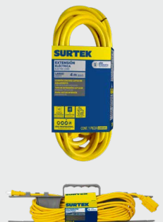
*Con porta extensión.