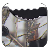
BLOQUEO DE NAVAJA, se presiona para cerrar.