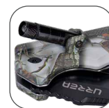
LINTERNA LED A BATERÍA, usa 4 baterías SR621W.