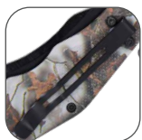
CLIP PARA cinturón.