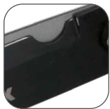
HOJAS con muesca.