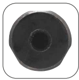
Zanco 1/2" con 3 planos de agarre